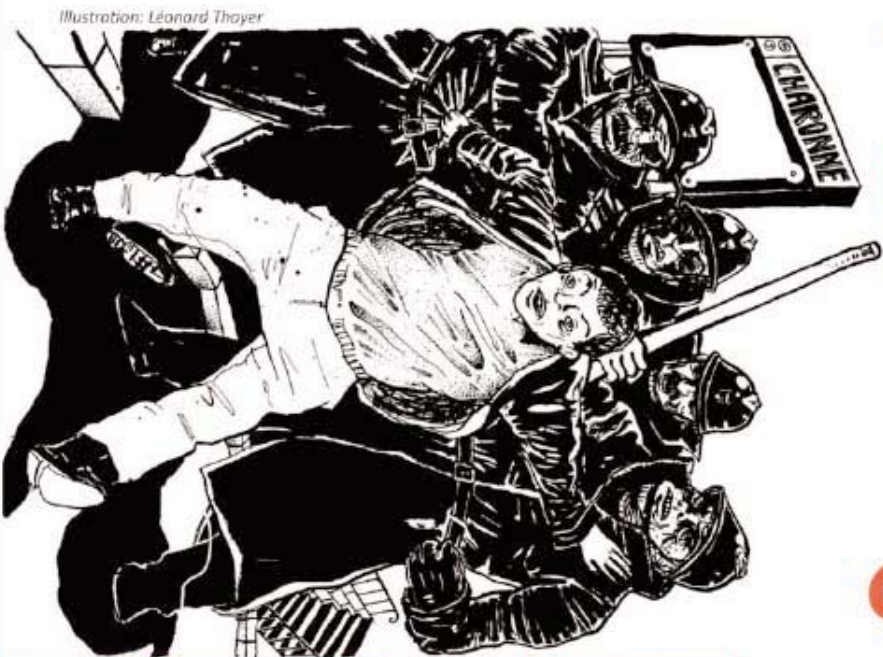
Illustration: Léonard Thayer