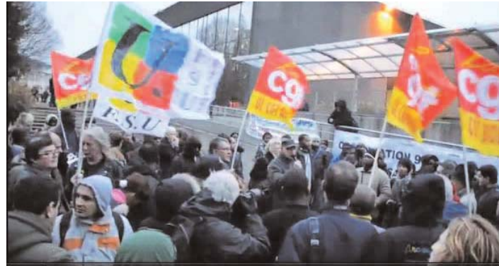
7 décembre, Préfecture de Bobigny

Dans plusieurs villes, grâce à la générosité des participants (ou d'une municipalité comme à Bobigny), un « petit déjeuner solidaire » a pu être offert à toutes les personnes qui faisaient la queue depuis des heures, certains depuis la veille, en espérant perdre le moins possible de leur journée de travail ou de cours. A Evry, Nanterre, et Paris, l'opération s'est accompagnée d'une aubade au préfet dans l'espoir que la musique adoucisse vraiment les mœurs ! A Créteil et Bobigny des travailleurs sans papiers en lutte s'étaient joints au rassemblement.