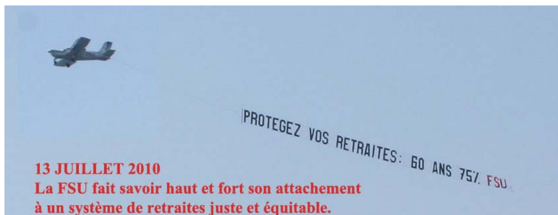
Initiative de la FSU 06, message visible de toutes les plages entre Fréjus et Antibes

Le gouvernement et les parlementaires doivent entendre la mobilisation des salariés et répondre à leurs revendications pour d'autres choix en matière de retraites, d'emploi et de pouvoir d'achat. Les organisations syndicales se réuniront dès le 8 septembre pour analyser la situation et décider des suites unitaires à donner rapidement à la mobilisation.